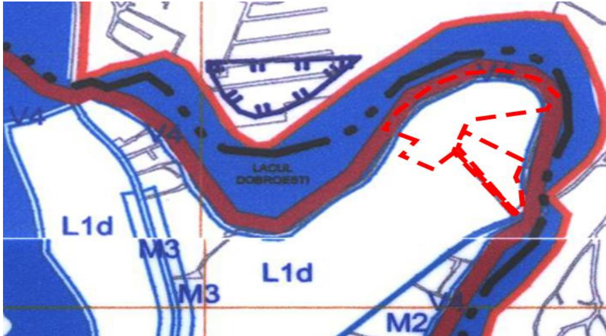
Extras din PUG Municipiul București, aprobat prin HCL 269/2000

Terenul specificat cu numerele cadastrale: 215859,215860,215866, 215865, se află încadrate conform Plan Urbanistic General Municipiul București aprobat prin HCL nr 269/2000 în subzona L1d – subzona de locuințe individuale mici cu parcele cu POT <20% situate în zona culoarelor plantate propuse pentru ameliorarea climatului Capitalei și V4 - spații verzi pentru protecția cursurilor de apă (Lacurile Colentinei).